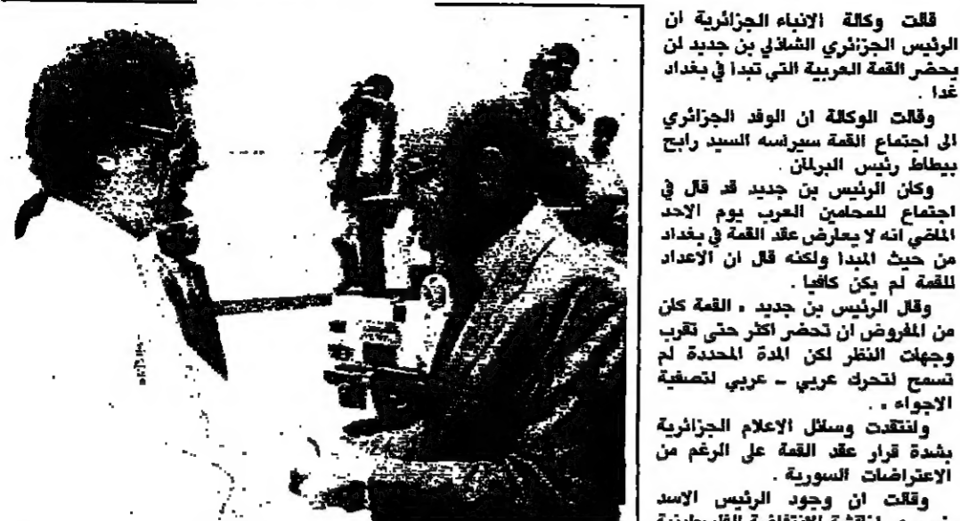
الأمم يستقبل القادافي لدى وصوله

قلت وكالة الأنباء الجزائرية ان الرئيس الجزائري الشاذلي بن جديد لن يحضر القمة العربية التي تبدأ في بغداد غداً. وقالت الوكالة ان الوفد الجزائري الى اجتماع القمة سيرأسه السيد رايح بيطاط رئيس البرلمان. وكان الرئيس بن جديد قد قال في اجتماع الصحافيين العرب يوم الأحد الماضي انه لا يعارض عقد القمة في بغداد من حيث المبدأ ولكنه قال ان الأعداد للقمة لم يكن كافياً. وقال الرئيس بن جديد، القمة كان من المفروض ان تحضر أكثر حتى تقرب وجهات النظر لكن المدة المحددة لم تسمح لحركة عربي - عربي لتصفية الأجواء. وتلقت وسائل الاعلام الجزائرية بشدة قرار عقد القمة على الرغم من الاعتراضات السورية. وقالت ان وجود الرئيس الاسد ضروري لتنشيط الانتفاضة الفلسطينية وهجرة اليهود السوفيات الى اسرائيل والأزمة اللبنانية.